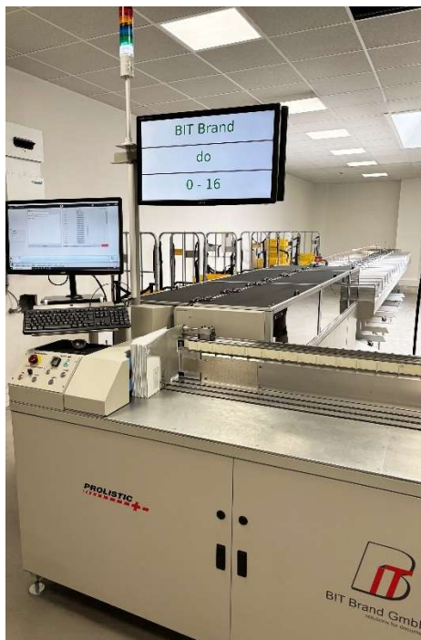
Systemübersicht aus Sicht des Operators (Front)

Die flexible Softwarearchitektur ermöglicht einen hohen Automatisierungsgrad. So werden unter anderem Briefbasisprodukte und Freimachungsarten automatisch erkannt und die Produktionsdaten in einem automatisierten Tagesabschlussbericht an das BIT-Brand-Datensystem übergeben.