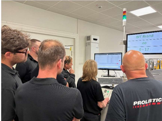
Technik- und Operatorschulung